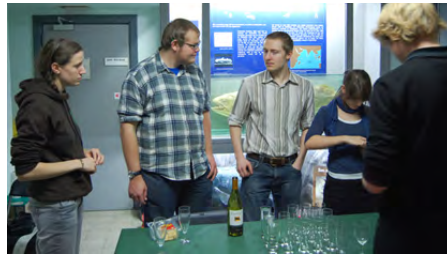
... verzorgd door het Biosteam.