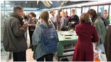
Receptie in het Museum voor Dierkunde...