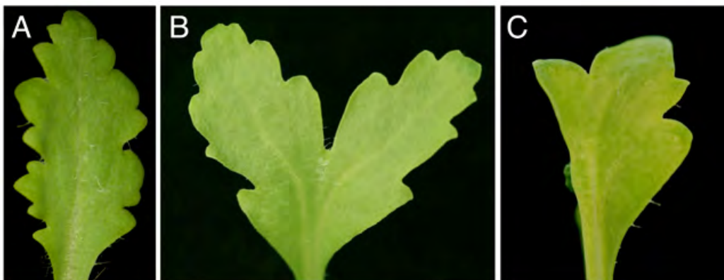
Knock-down via virusgeïnduceerde 'gene silencing' van een gen verantwoordelijk voor overgangen in de levenscyclus van Papaver somniferum (papaver). Twee microRNA's komen sterker tot expressie ten gevolge van de knock-down waardoor er verschillende fenotypes in bladvorm, beharing and celgrootte ontstaan. (A) Negatieve controle met een lege vector; (B) zwak fenotype; (C) sterk fenotype (Viaene en Geuten, ongepubliceerde data).

Toen ik toekwam in Leuven was het even slikken. Op persoonlijk vlak was er eerst weinig tijd om me terug te nestelen in een vriendengroep waarmee ik twee jaar lang minder tijd had kunnen doorbrengen en de reden was dat ik nogal geabsorbeerd werd door het werk. Die eerste maanden moesten er preliminaire data verzameld worden voor projectaanvragen, er moest allerhande kennis doorgegeven worden aan mensen in het labo, ik moest voor het eerst vakken geven... en verder moest ik erg wennen aan leiding geven aan een labo. Maar er was tegelijkertijd ook wel geruststelling: eigenlijk voel ik dat dit iets is wat ik fundamenteel erg graag doe. Lesgeven vind ik heerlijk (als ik de tijd heb kunnen vrijmaken om het erg goed voor te bereiden) en onderzoek doen (of wat helpen sturen) is nog leuker. Het is ook enorm bevrijdend om je eigen ideeën met succes te zien ontwikkelen, met alle verrassingen vandien. Dus eens de wagen nog een beetje sneller aan het bollen is, denk ik dat er nog veel meer plezier bij zal komen!